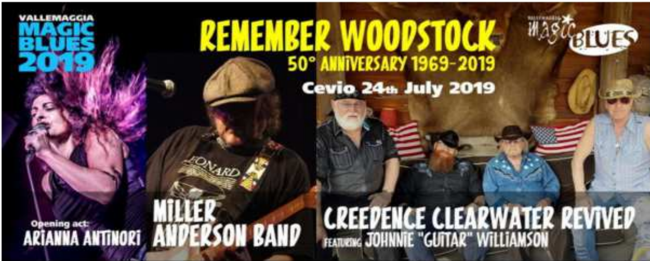
Il ricordo di Woodstock mercoledì sera al Magic Blues.