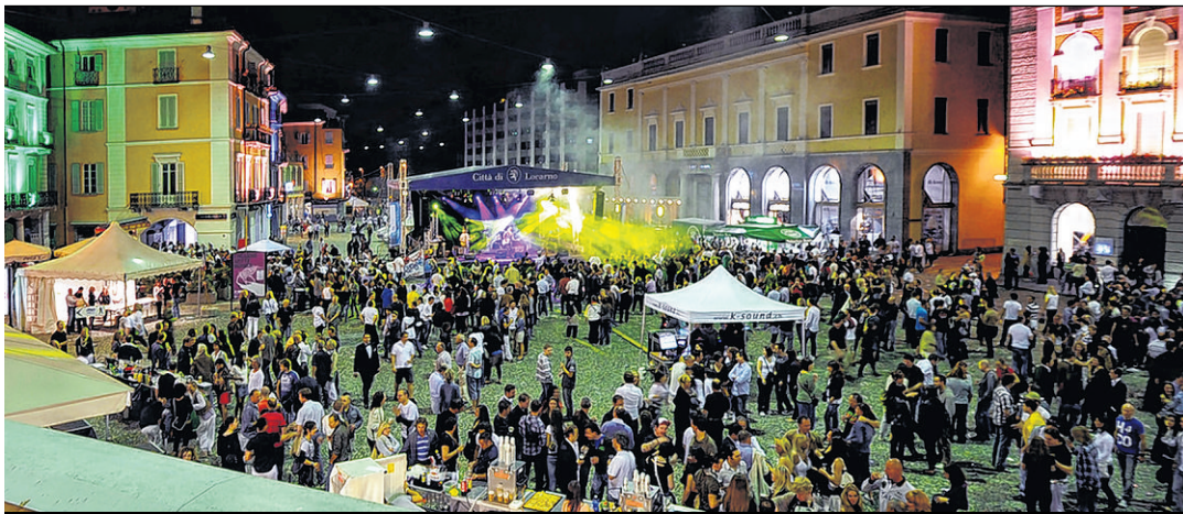
Piazza Grande ancora piena nel cuore della notte